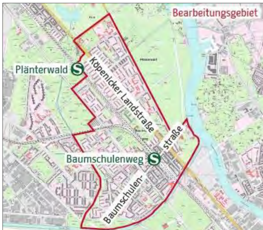
Abb. 1: Bearbeitungsgebiet (Kartengrundlage: Geoportal Berlin/Karte von Berlin 1:5.000)

Im südlichen Teil des Gebiets befindet sich das Ortsteilzentrum Baumschulenweg. Mit dem Treptower Park im Norden, dem Plänterwald, dem Spreepark und der Spree im Osten sowie der Königsheide und dem Späth-Arboretum und dem Friedhof Baumschulenweg im Süden grenzen unmittelbar stadtbedeutende Orte der Erholung und der Kontemplation an.